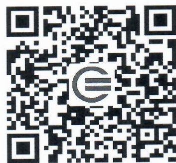
教育装备网公众号二维码

2. 参观人员请扫描右方的二维码，关注“教育装备网”微信公众号，于 9 月 24 日后在报名入口点击“观众预报名”并按要求如实填写相关信息生成报名码，凭报名码到现场换取“参观证”进场观展。